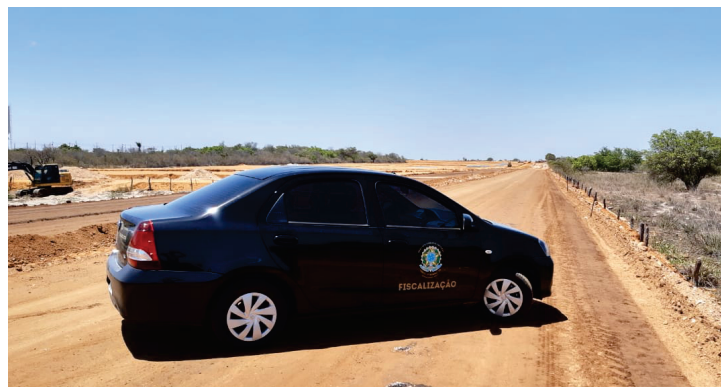
Nova viatura do CRECI-PE

“Fiscalizar é o ato de acompanhar e supervisionar determinada atividade ou ação da sociedade regida por normas ou leis específicas prevista em um estatuto, código de lei ou ação normativa”. – Manual de Fiscalização Sistema COFECI/CRECI.